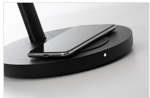
Motus Table inductieve tafelbasis (IND BASE)