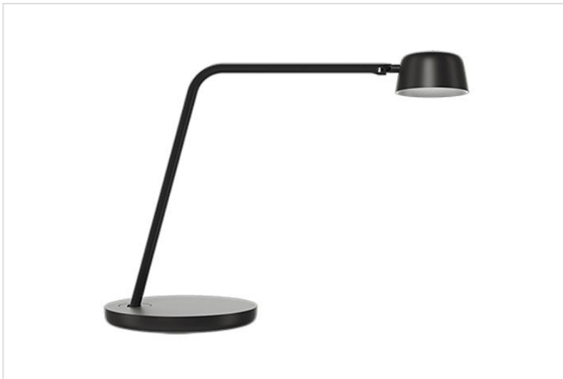
Motus Table met tafelbasis (BASE)

Met drie ingenieuze bewegingsmanieren kunt u het lamphoofd van Motus Table vloeiend op de gewenste plek richten en zo het licht plaatsen waar het nodig is. Deze veelzijdige bureaulamp heeft een vaste arm met één scharnier in de basis en één bij het lamphoofd.