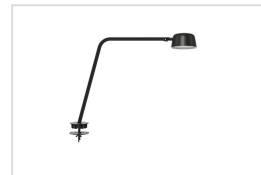
Motus Table met inbouwbeugel (INTEGR MNT)