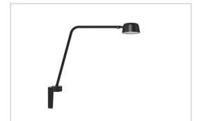
Motus Table met een wandbeugel (WALL MMT)