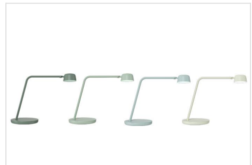
Motus Table - Luxo Colour Concept