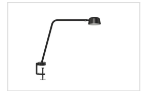
Motus Table met tafelklem (CLAMP)