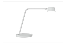
Motus Table - wit